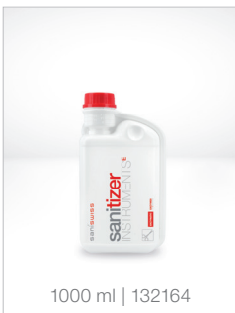
1000 ml | 132164

Nouveau concentré désinfectant à 3 enzymes pour les instruments médico-chirurgicaux, le matériel d'endoscopie, le nettoyage et la désinfection avant la stérilisation. En cas de faibles concentrations d'application, il existe un large spectre d'action contre les bactéries, les levures et les virus. Efficace à partir de 5 minutes sur la plupart des agents pathogènes. L'intégrité des instruments est garantie jusqu'à 72 heures de trempage.