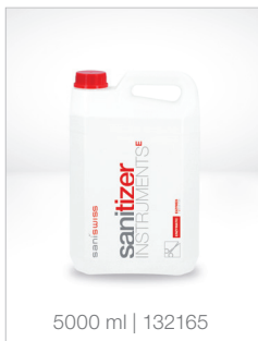
5000 ml | 132165